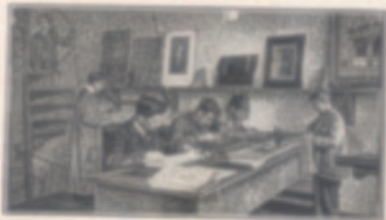
Secção de retoques

Receta, pois, com os cumprimentos pelos triunfos que me é grato assinalar, os protestos da mais viva consi- deração pelos seus esforços coroados de sucesso perdu- rável e magnífico.