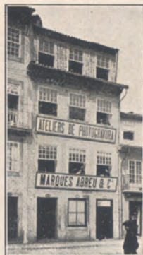
Prédio onde estão instalados os escritórios

Veja o leitor, se, para crer mais depressa, lhe fôr necessário ver primeiro. Num amplo espaço, bem arejado e bem banhado da luz que mais lhe convem, acham-se dispostas, em lugares prévios-