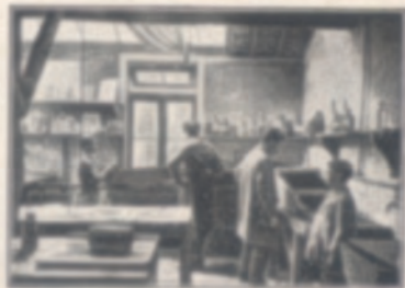
Um aspecto da secção de zinco gravura